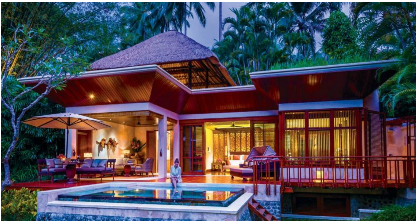
Four Seasons Resort Sayan

Banyak resor menyuguhkan fasilitas yang cantik dan indah, namun tidak semua memberi nuansa kemewahan kolam renang sambil Anda menikmati segarnya suasana alam. Berikut kami rangkum lima hotel dengan kolam renang ultra keren di Bali yang mungkin bisa menjadi referensi Anda untuk liburan akhir tahun.