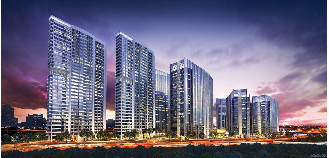
Superblock Ciputra International.

Superblock ini memang dibangun untuk menjadi Central Bisnis District yang terintegrasi. Karena itu Ciputra Group lebih banyak membangun perkantoran ( 6 tower ) berbanding dengan 3 tower apartemen dan 1 tower hotel berbintang dengan fasilitas Convention Hall . Wajar saja jika unit apartemen di kawasan Ciputra International ini diyakini akan memberi gain yang baik bagi pemiliknya.