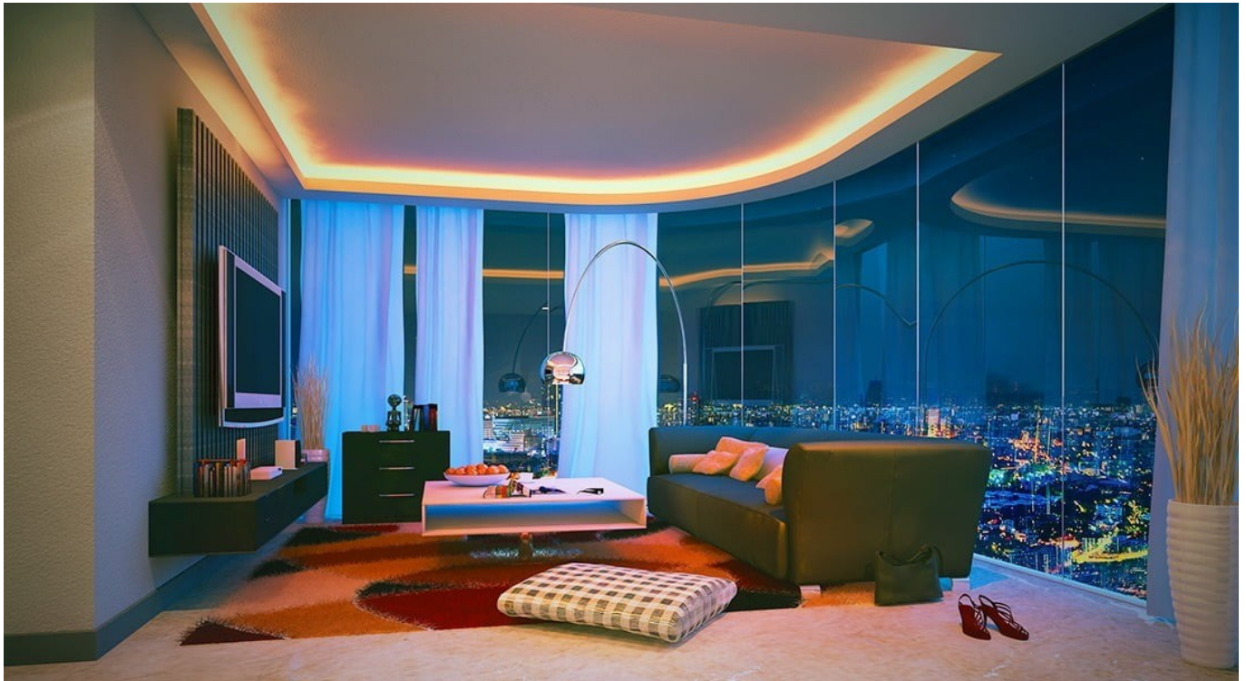
Penthouse Amazana Serpong Residences.

Serpong Residences telah mencatatkan pertumbuhan harga hingga 35 persen. Diprediksi angka ini akan terus bergerak naik karena lokasi strategis Amazana yang berada tepat di exit tol Kunciran – Alam Sutera yang sedang dibangun.