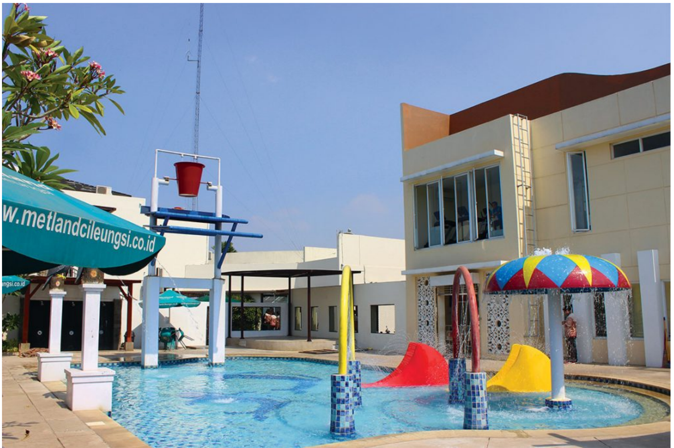
Clubhouse Metland Cileungsi.

Merespon demand yang tinggi itu, Metland Cileungsi meluncurkan cluster premium The Colony. Cluster baru ini sudah mulai dipasarkan dengan tawaran harga dari Rp 500 jutaan sampai Rp 800 jutaan.