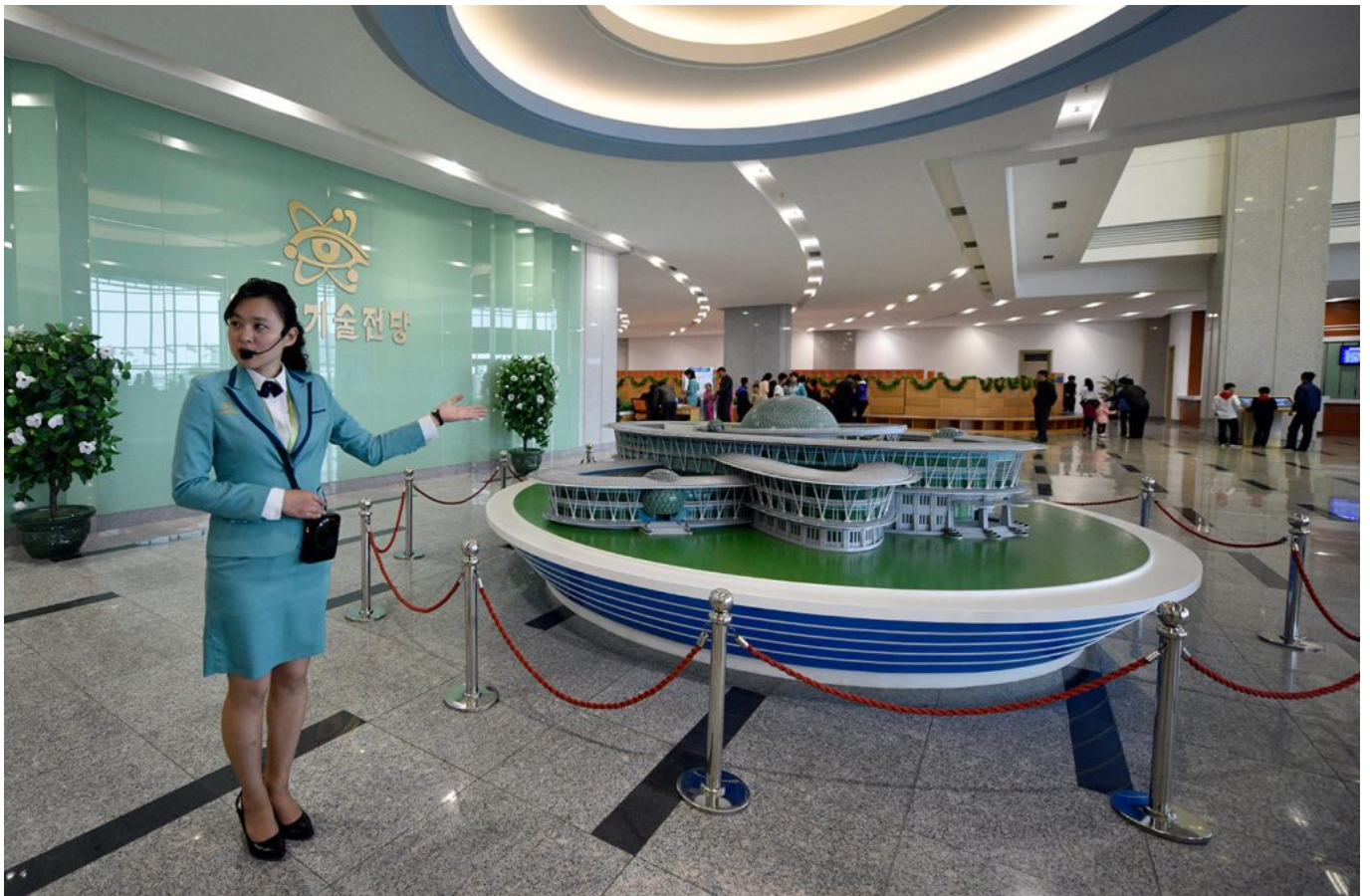
Sci-Tech Complex

Percaya atau Tidak? Arsitektur Menakjubkan ini Berada di Korea Utara