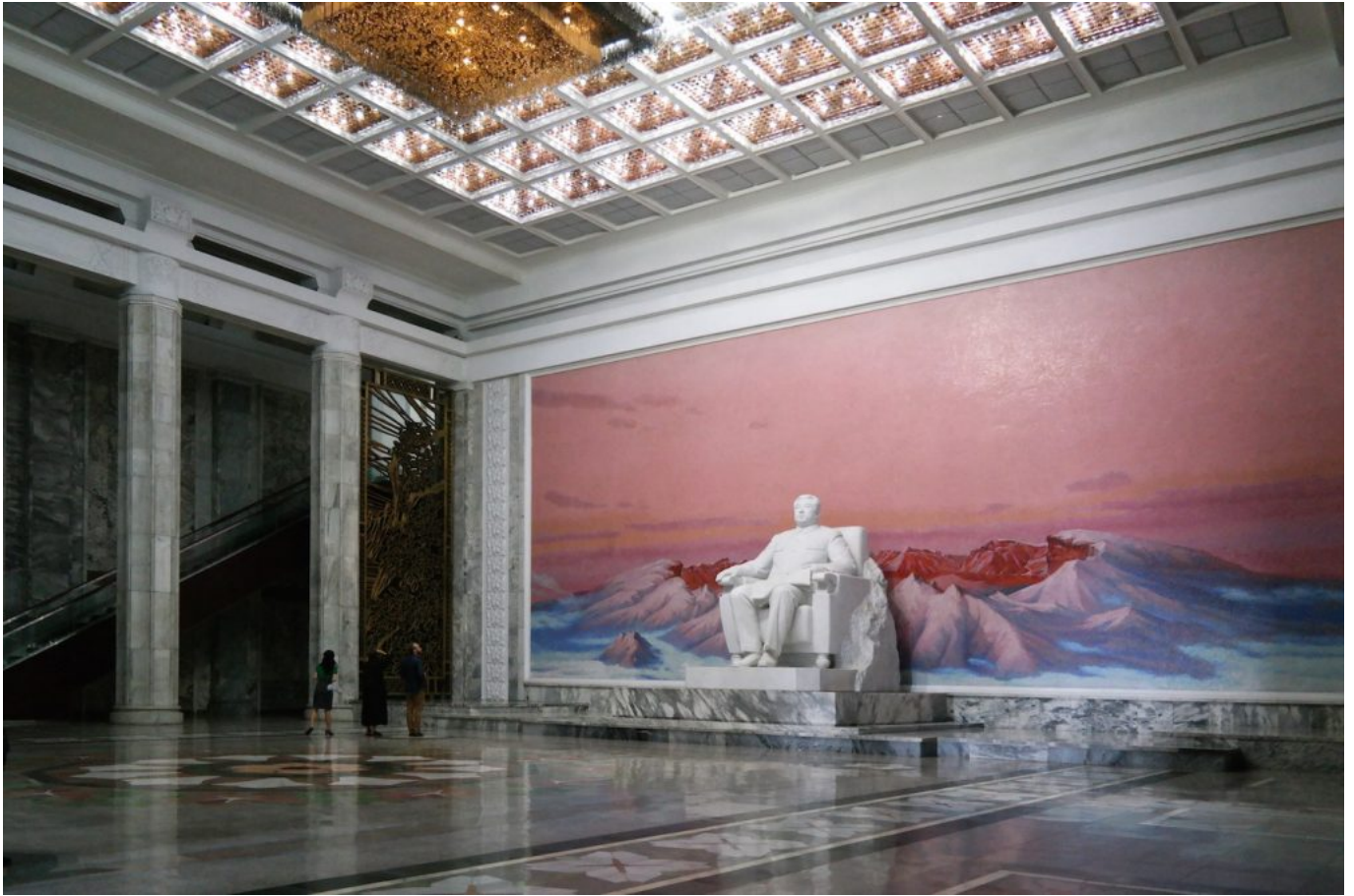
Grand People's Study House, Pyongyang (Oliver Wainwright).