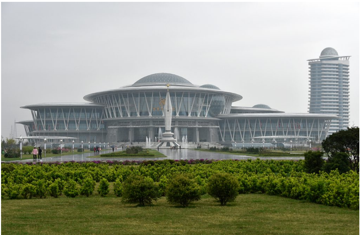
Sci-Tech Complex

Korea Utara juga memiliki sebuah mega proyek yang bernama Sci-Tech Complex, kita kan disugui sebuah pemandangan menakjubkan di sini. Komplek ini dibangun Kim Jong-un untuk pengembangan ilmu dan pengetahuan Korea Utara.