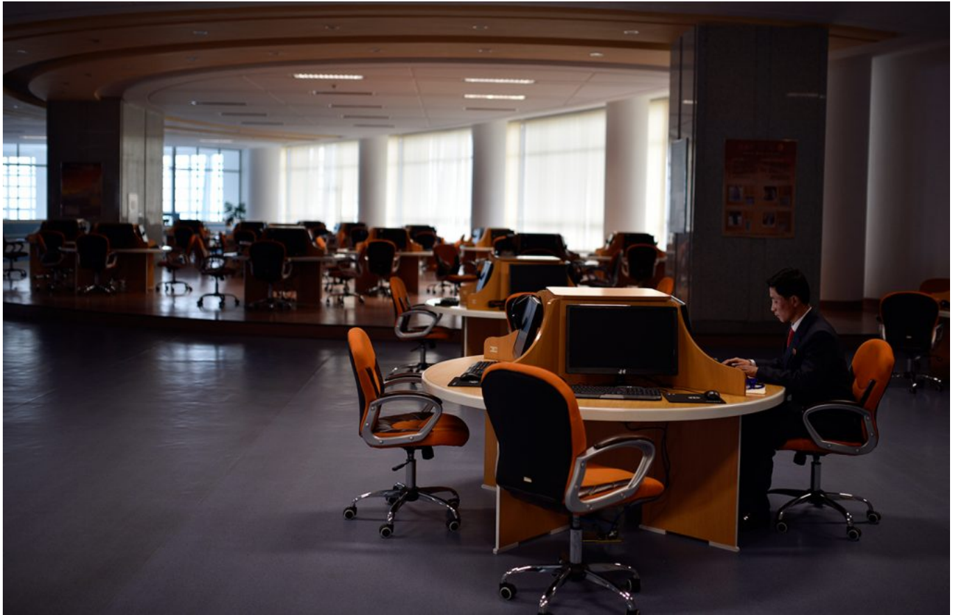
Sci-Tech Complex

Fotografer Oliver Wainwright menyebut, Korea Utara memanfaatkan arsitektur layaknya estalase toko sebagai alat untuk memamerkan keagungan dan kekuasaan para pemimpinnya. Seluruh elemen seperti patung maupun lukisan wajib ditata secara rapi, teliti, dan hati-hati.