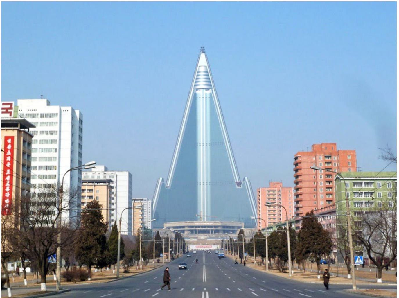
Ryugyong Hotel

Seperti diketahui, memang perkembangan arsitektur dan desain kota-kota di Korea Selatan sangat mencolok dan modern, bertolak belakang dengan saudaranya Korea Utara yang katanya ketinggalan itu.