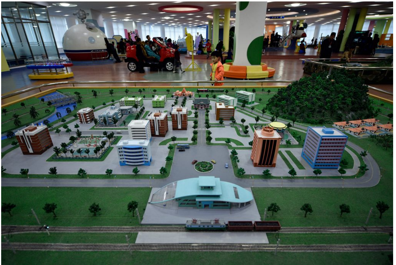
Sci-Tech Complex (Franck Robichon-EPA)

Percaya atau Tidak? Arsitektur Menakjubkan ini Berada di Korea Utara