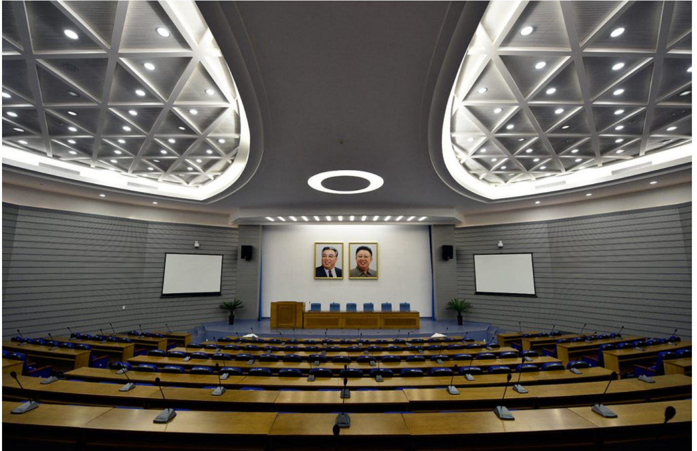
Sci-Tech Complex

2016 lalu. Riset senjata nuklir, biologi, dan informatika menjadi fokus utama proyek ini. Di sini, arsitektur gedung tampak sangat modern dengan desain interior yang mewah.